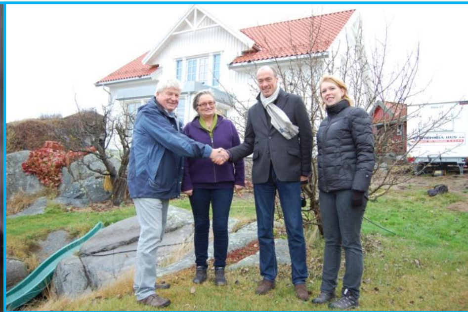
Husbrann Sandøya, Porsgrunn. Befaring sammen med Naturvernforbundet. Nytt miljøvennlig hus ble gjenreist.